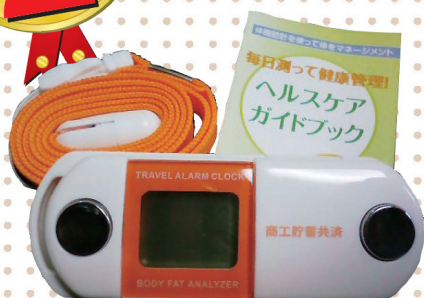
ペンダント型体脂肪計