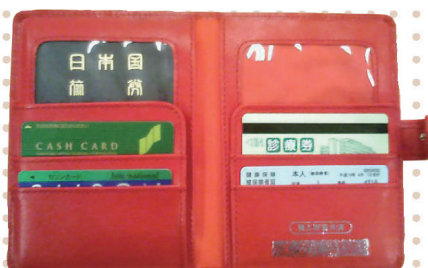
保険証・パスポートケース